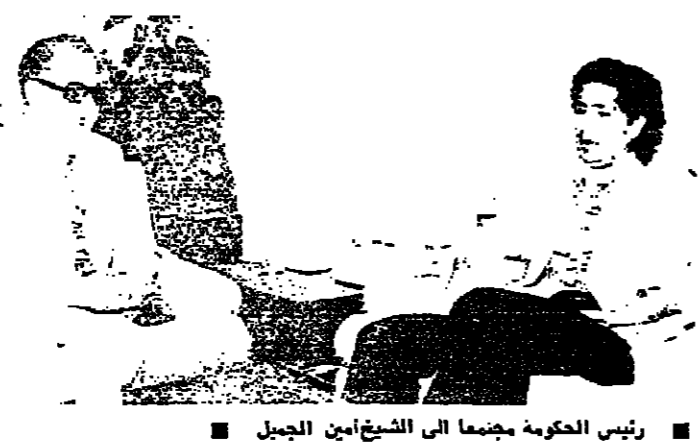
رئيس الحكومة جيمعنا الى الشيخ امين الجميل

الذي من شأنه اعادة الامن والاستقرار الى هذه المنطقة . واضاف : لقد طرحنا على الكثيرين من المسؤولين اللبنانيين والعرب المتحكمين حول وجود العدائين في الجنوب بالشكل الذي هم عليه اليوم ، فاذا كان ذلك يختم القضية العربية ويهدد نهركم ضمن اطار رسالتهم ، نحن على استعداد لان نبحث هذا الامر . اما اذا كان هذا الوجود بهذا الشكل الفوضوي لا يبيد القضية ، بل يعرض لبنان والدول العربية كافة الى اخطار لا يمكن لاحد ان يتصور عواقبها ، فنقتضي اذا معالجة الامر بموضوعية اكثر ، وبغض النظر عن ان الوضع الفلسطيني اليوم في لبنان هو تحدٍ سائر لكل مقررات الحوكم والارصاد العرب ، ولم يعد احد يحرم او يحد هذه الاثرات فيما لو بقيت حبرا على هذه الصفحة ٩ -